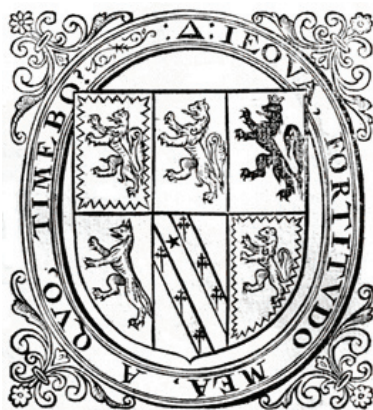
Znak Johna Dee