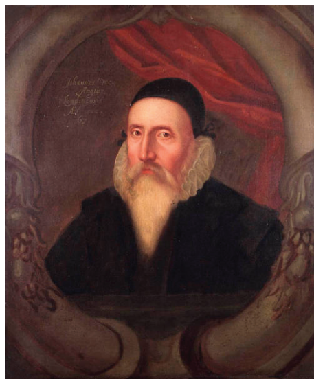
John Dee na obraze neznámého autora, ze sbírky Ashmoleova muzea v Oxfordu

John Dee byl významný alžbětinský matematik, astronom, alchymista, astrolog a okultista. Narodil se v roce 1527 v Londýně v rodině bohatého obchodníka, původem z Walesu. Jméno „Dee“ je odvozeno z waleského „ du “, tj. „černý“. Rodina J.Dea se do Londýna přistěhovala z Walesu v době korunovace Jindřicha VII. Tudora.