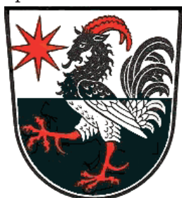
Znak obce Ziegenhain

Hessensko je pozoruhodné z pohledu heraldiky nejen přítomností kozích hlav na těle orlů v erbech obcí i fyzických osob, ale i pozoruhodným erbem města Ziegenhain . Poprvé je tento erb města Ziegenhain připomínán v roce 1519. Ziegenhain je okresní město stejnojmenného německého okresu na severu spolkové země Hessensko.